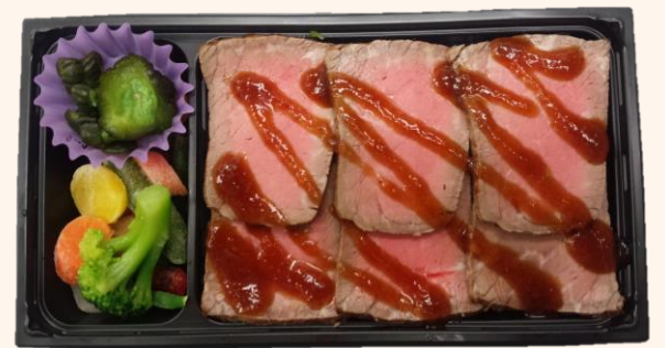
黒毛和牛ステーキ御膳(A-15) (やわらかくて脂の少ない赤身肉ステーキが 入った人気の一折) 税込価格 1,100円