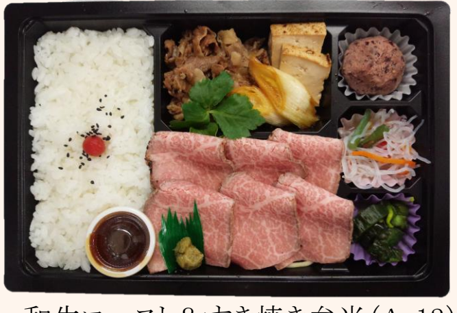
和牛ロースト&すき焼き弁当(A-12) 税込価格 2,000円