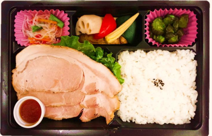
やわらかポーク御膳(A-13) (独自の製法で、やわらかく焼き上げ、 豚肉の美味しさを引出しました) 税込価格 1,000円