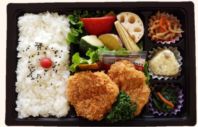
ひれカツ&蒸し野菜弁当(A-5) 税込価格 1,000円