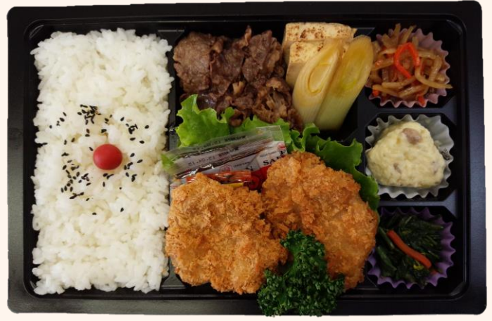
ひれカツ&すき焼き弁当(A-3) 税込価格 1,350円

季節に応じてお弁当の内容を変更しております。 商品画像と異なる場合が御座いますので、予めご了承ください。